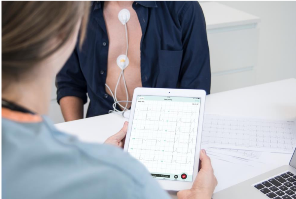
CardioSecur Pro beim Einsatz in der Arztpraxis

Personal MedSystems GmbH Eduard Lerperger Telefon +49 (0) 151-19120692 press@cardiosecur.com