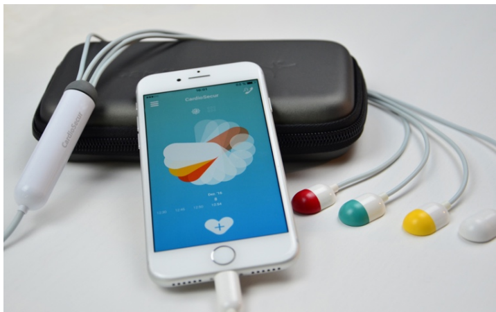
CardioSecur Active für iPhone

Personal MedSystems GmbH entwickelt und vertreibt unter dem Namen CardioSecur mobile EKG-Systeme und Dienstleistungen für Privatanwender und medizinisches Fachpersonal. CardioSecur Active ist ein innovatives 15-Kanal EKG in klinischer Qualität für die private Nutzung. In nur wenigen Sekunden erzeugt es ein individualisiertes Feedback über Veränderungen der Herzgesundheit und gibt eine einfache Handlungsempfehlung, ob ein Arzt aufzusuchen ist oder nicht. Das gesamte System besteht aus einem 50-Gramm-leichten Kabel mit vier Elektroden, der kostenlosen CardioSecur Active App und dem Smartphone oder Tablet des Nutzers. CardioSecur Pro ist die mobile, klinische EKG-Lösung für Ärzte und medizinisches Fachpersonal. CardioSecur Pro ermöglicht gemäß den Leitlinien der kardiologischen Fachgesellschaften mit 22 Kanälen eine 360° Sicht auf das Herz und erkennt damit als einziges System Vorder-, Lateral- und auch Hinterwandinfarkte des Herzens.